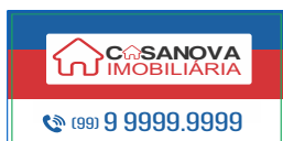
Página 02 Impressão Verso