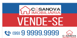
Página 01 Antes de gerar o arquivo em PDF/X1-a pra impressão, exclua todas as linhas do gabarito.