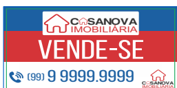
Página 01 Impressão Frente